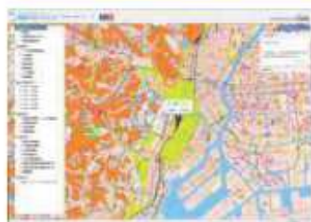
地盤サポートマップ ( http://www.j-shield.co.jp/1million/cp2.htm )