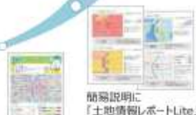
集客ツールに「地盤サポートマップforU」